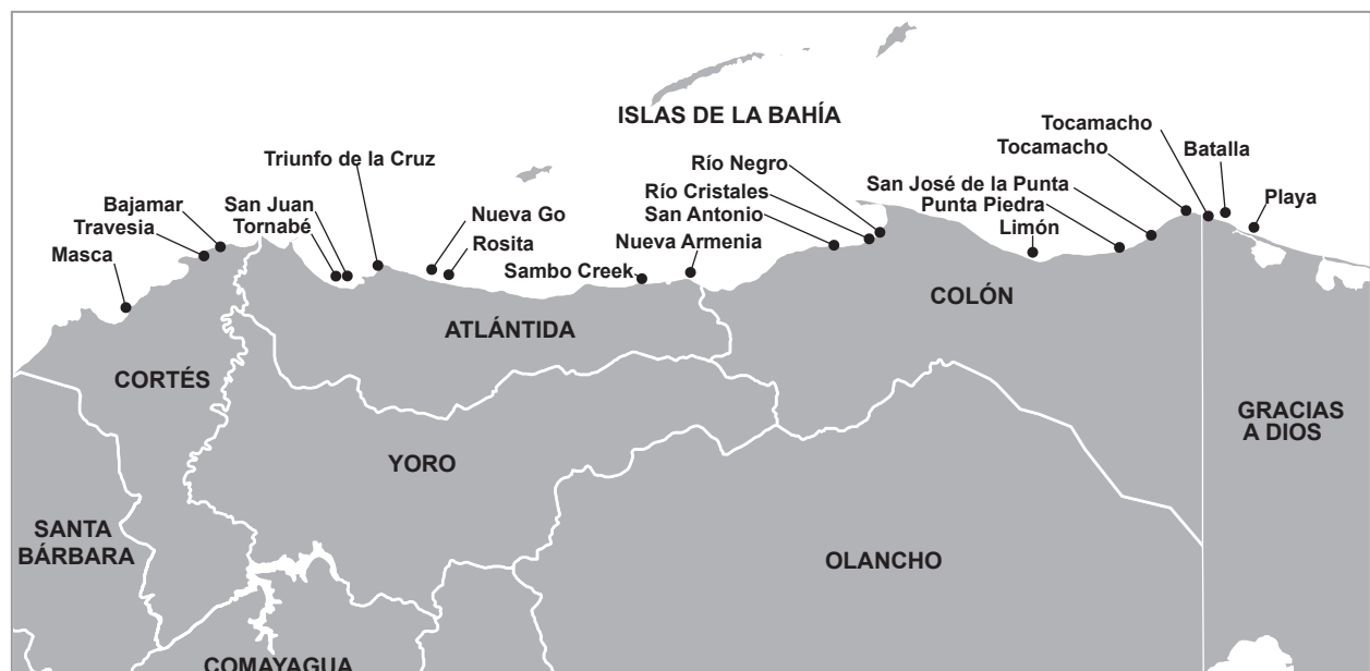
Mapa de comunidades del pueblo Garífuna